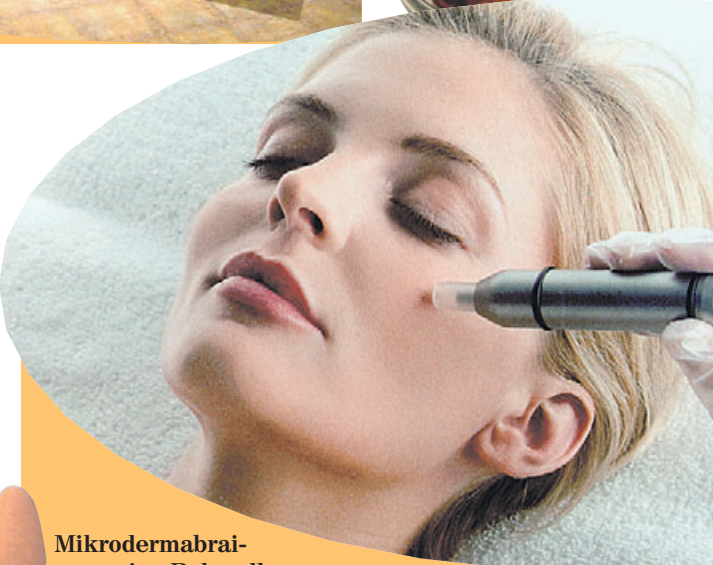
Mikrodermabrasion - eine Behandlung zur Regeneration der Haut mit sofortigem Lifting Effekt